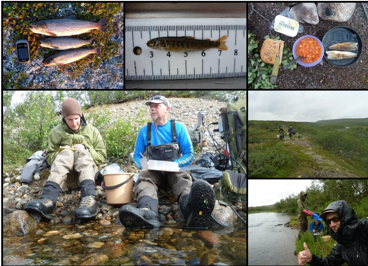
Bilder fra ungfiskundersøkelse i Lákjohkvassdraget.