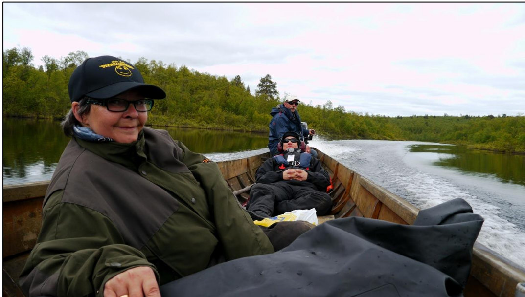
Bilde: Befaring med TF i øvre Karasjohka og Bavvtajohka.