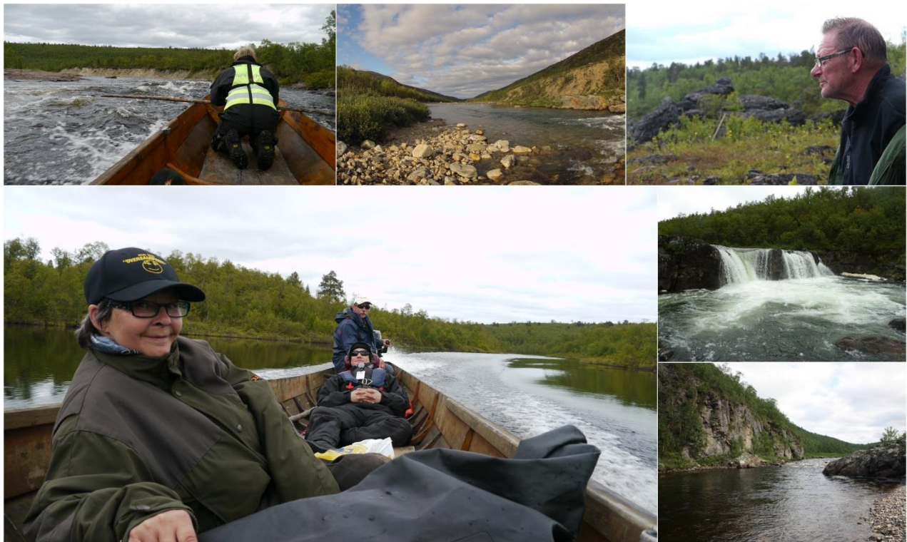
Bilder fra befaringer i sideelvene i 2014

Behandlet ved møte 8. - 9. april 2014, sak 20/2014.