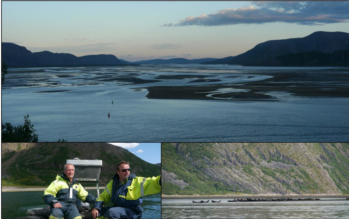
Tanamunningen. Forsøk på merking av seler i Tanamunningen, 2013.

I 2013 ble det satt i gang en prosess med å gi Tanavassdraget nye gytebestandsmål. I første omgang har Miljødirektoratet prioritert å etablere et mål for hele det lakseførende vassdraget ut i fra den vel etablerte metoden for førstegenerasjons gytebestandsmål. Dette har resultert i NINA-rapport 1087. På sikt er målet å innføre et andregenerasjons mål tuftet på større grad av objektive mål hentet inn fra felt. Blant annet denne langtidige målsetningen lå bak ungfiskundersøkelsen i Lakšjohka og Iškorasjohka. TF bidro også med habitatkartlegging ut i fra samme målsetning, og i de samme sideelvene.